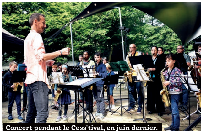
Concert pendant le Cess'tival, en juin dernier.