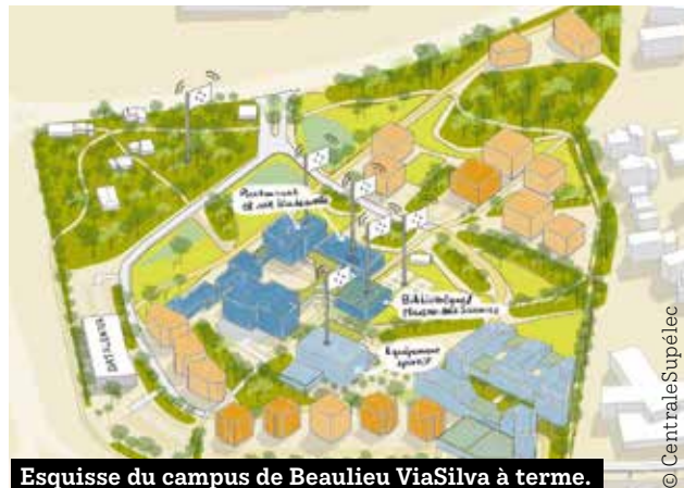
Esquisse du campus de Beaulieu ViaSilva à terme.