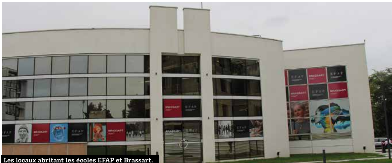
Les locaux abritant les écoles EFAP et Brassart.

Deux écoles ont ouvert lors de cette rentrée sur un même lieu, dans des locaux rénovés, rue de la Touraudais. Il s'agit de l'école de communication Efap et de l'école des métiers de la création Brassart.