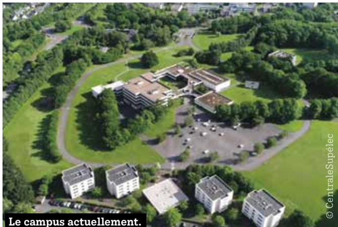
Le campus actuellement.