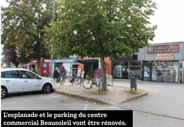
L'esplanade et le parking du centre commercial Beausoleil vont être rénovés.

Pour répondre à une demande des commerçants, des travaux vont être entrepris sur l'esplanade et le parking du centre commercial Beausoleil. Ils visent à améliorer l'expérience des visiteurs tout en s'inscrivant dans une démarche de développement durable. Au programme, l'embellissement de l'esplanade, la rénovation des bancs et des appuis-vélo, la végétalisation et la désimperméabilisation des sols. Les places de stationnement du 1 er rang côté centre commercial seront élargies pour un meilleur confort des usagers. Les travaux seront mis en œuvre, par Rennes Métropole, à la fin du mois d'octobre, pour une durée de 3 semaines. Les travaux nécessitent le remplacement de certains arbres, remplacés par la plantation d'arbres tiges Fraxinus et Parrotia assortis de plantes couvre-sols.