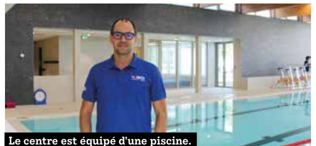
Le centre est équipé d'une piscine.