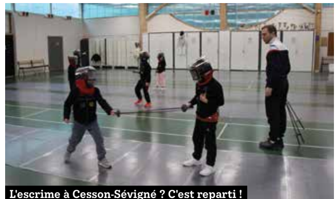
L'escrime à Cesson-Sévigné ? C'est reparti !