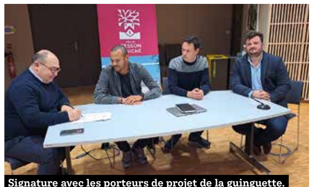
Signature avec les porteurs de projet de la guinguette.

Un peu de patience, le projet ouvrira ses portes avant l'été 2025.