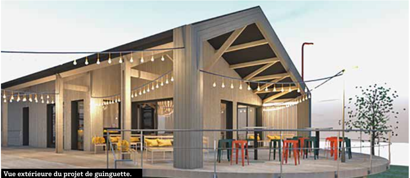
Vue extérieure du projet de guinguette.