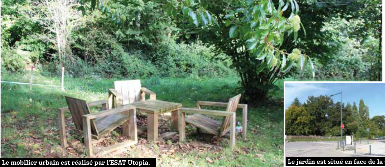
Le mobilier urbain est réalisé par l'ESAT Utopia.