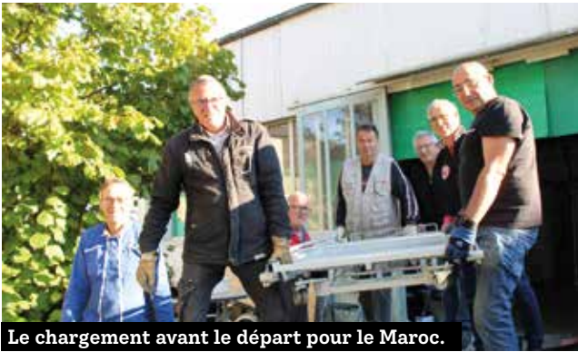
Le chargement avant le départ pour le Maroc.

Cesson 35 aide humanitaire a pour objectif de collecter et de remettre en état du matériel médical, tels que des lits, fauteuils roulants, déambulateurs... n'ayant plus vocation à être utilisés en France mais pouvant répondre aux besoins de personnes au Maroc. Dix membres de l'association sont partis en octobre pour un convoi humanitaire.