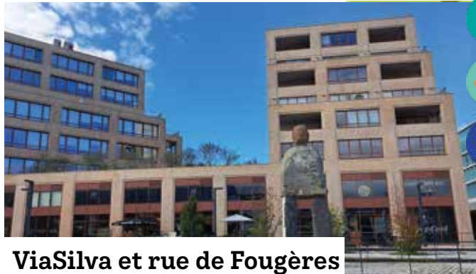
ViaSilva et rue de Fougères

Au pied de la station de métro la boulangerie et les restaurants animent le quartier en attendant d'être rejoints par la future Halle Gourmande. Pensez à vous arrêter rue de Fougères pour découvrir la vitalité des commerces.